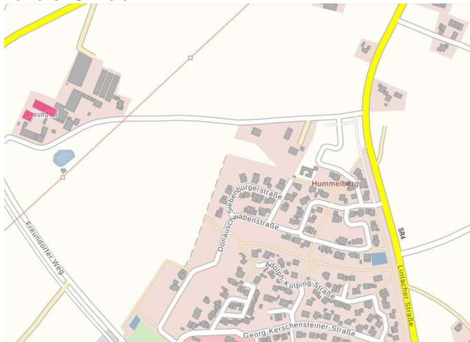
Auszug aus dem BayernAtlas

Nach Auskunft des BayernAtlas ist im Plangebiet kein Baudenkmal vorhanden, jedoch im näherer Umfeld.