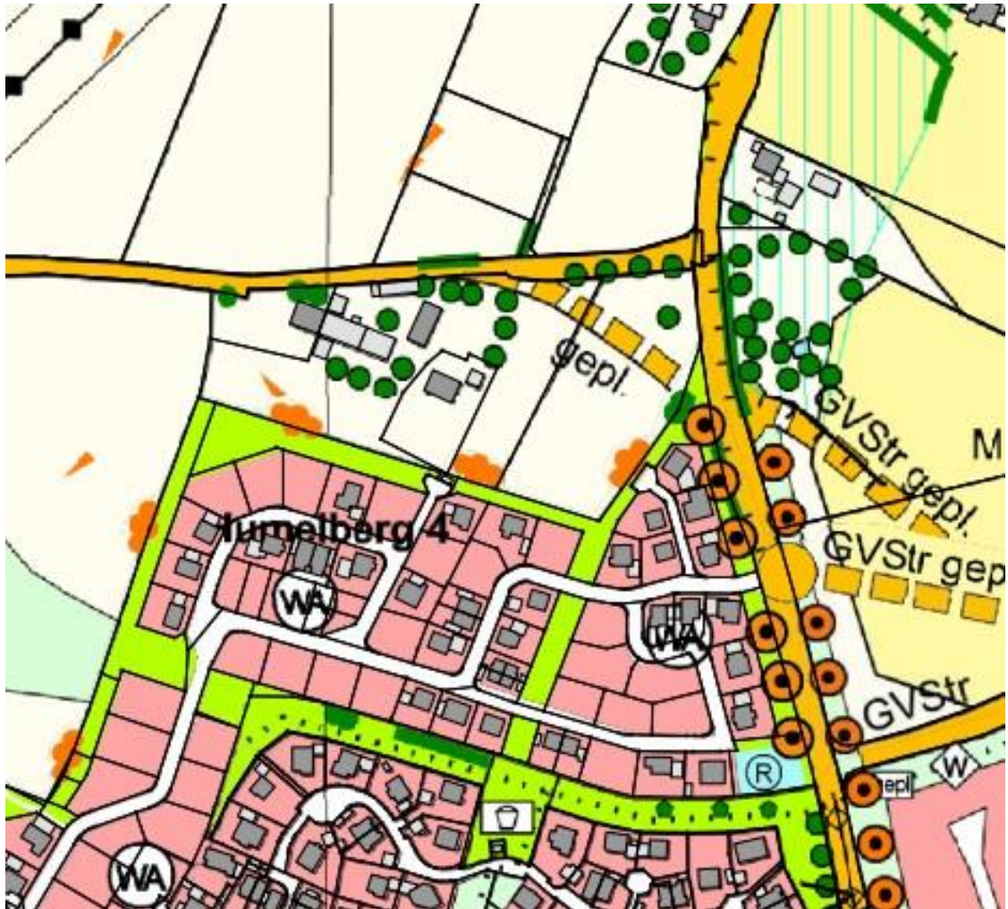
Ausschnitt rechtswirksamer Flächennutzungs- und Landschaftsplan

Der rechtskräftige Flächennutzungs- und Landschaftsplan der Stadt Bogen stellt das Vorhabensgebiet als landwirtschaftliche Flächen im Außenbereich dar. Der Flächennutzungs- und Landschaftsplan werden angepasst.