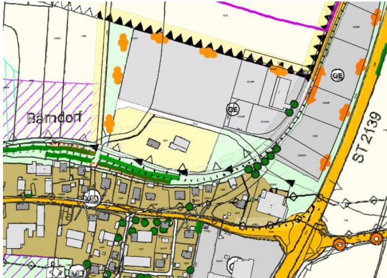
Auszug aus dem derzeit gültigen FNP

Der Flächennutzungsplan mit integriertem Landschaftsplan wird derzeit mittels Deckblatt Nr. 53 geändert.