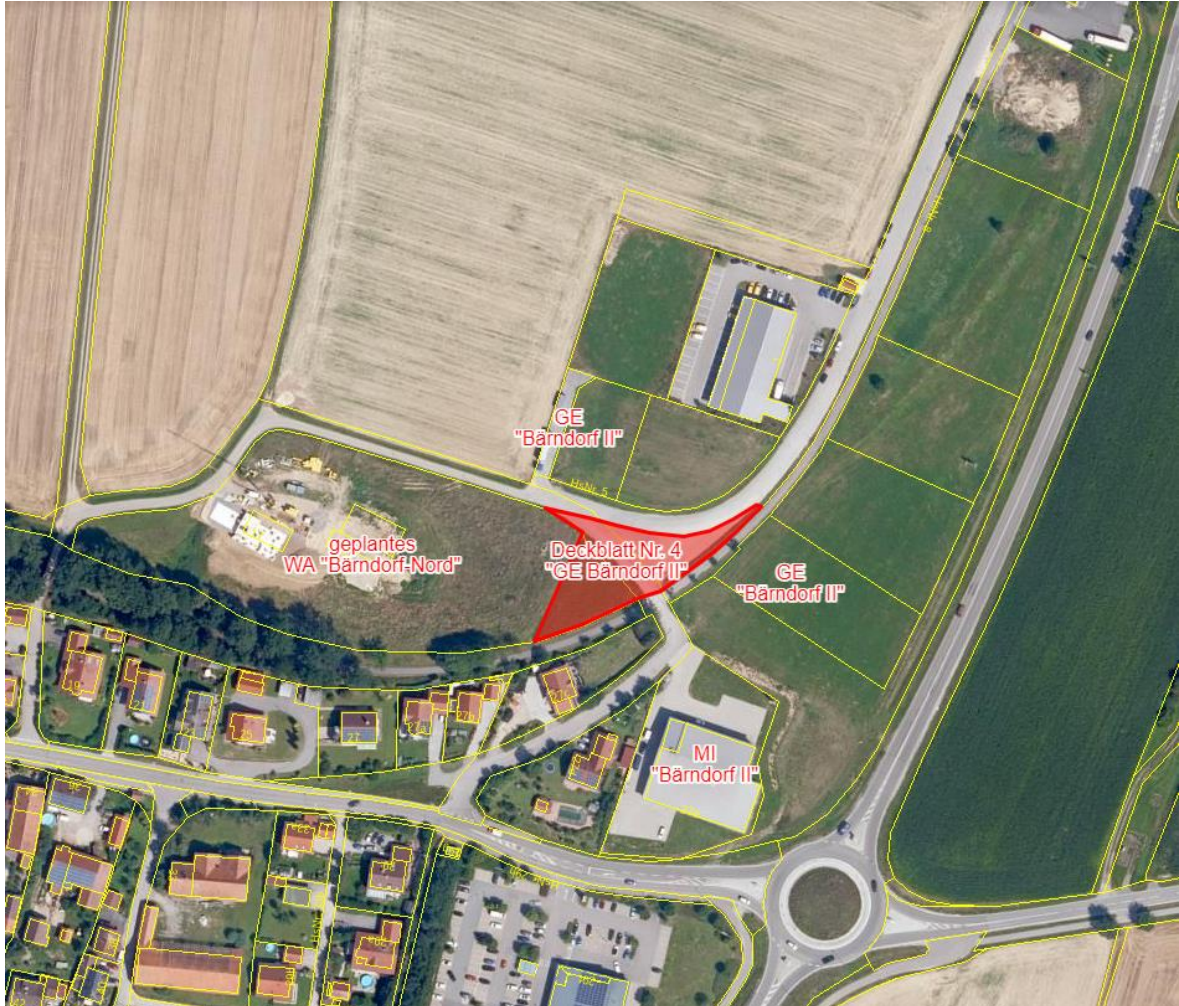
Luftbildausschnitt ohne Maßstab