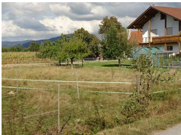
Abbildung 3: Blick von der GV-Str. von Süden auf das vorh. Anwesen mit Obstbäumen; links in der Bildmitte (im Bereich des Maisfeldes) die geplante PV-Anlage