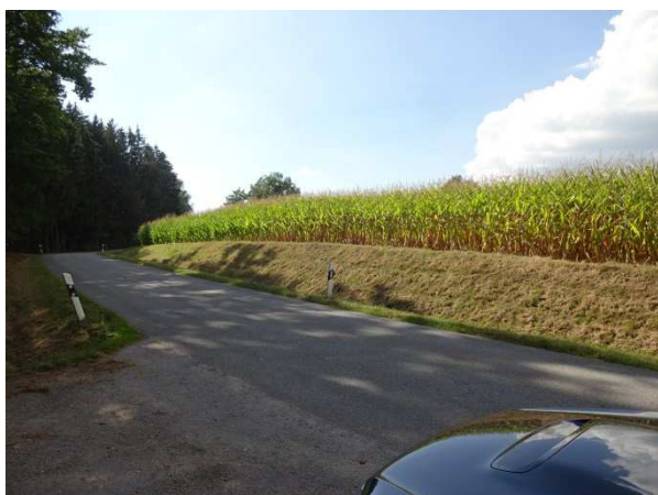
Abbildung 2: Blick von der GV-Str. im Osten auf die geplante PV-Fläche (derz. Maisfeld)

Das Planungsgebiet liegt im Ortsteil Waidholz der Stadt Bogen. Die Freiflächen-Photovoltaikanlage entsteht ausschließlich auf einer relativ ebenen Ackerfläche und liegt südlich einer überwiegend Gehölz-bewachsenen, hohen Böschung zur Bundesautobahn A 3 hin. Südlich grenzt das bestehende Gehöft des Grundstücksbesitzers an, westlich schließen weitere landwirtschaftliche Nutzflächen an. Im Osten verläuft die Gemeindeverbindungsstraße von Welchenberg nach Gaissing/Schwarzach mit einem angrenzenden Fichtenforst.