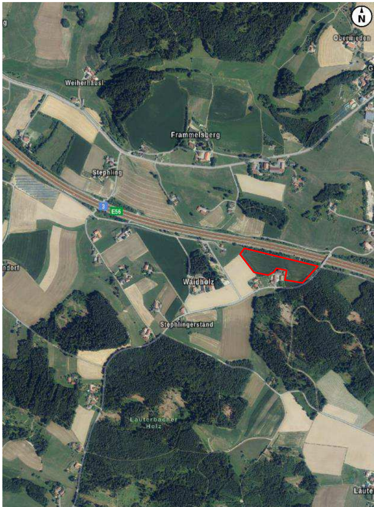
Abbildung 5: Luftbildausschnitt aus dem BayernAtlas vom 05.09.2020 – Maßstab ca. 1:5.000