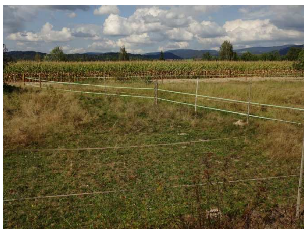
Abbildung 4: Blick von der GV-Str. von Süden auf die geplante PV-Fläche (im Bereich des Maisfeldes)