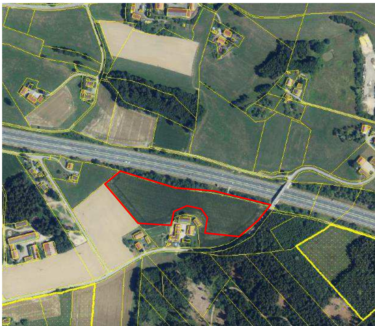
Abbildung 6: Luftbildausschnitt aus dem BayernAtlas vom 25.07.2020 – Maßstab ca. 1:5.000

Das Planungsgebiet mit einer Fläche von ca. 2,6 ha liegt im Ortsteil Waidholz der Stadt Bogen südlich der Bundesautobahn A 3. Der Geltungsbereich umfasst einen Teil der Fl. Nr. 1645 der Gmkg. Degernbach.